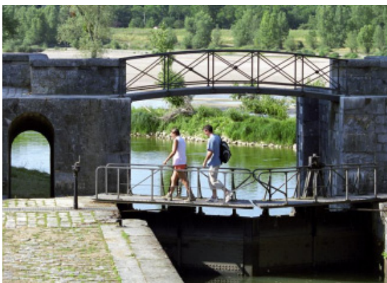
Ecluse de Mantelot - randonneurs

Saint-Martin-en-Haut (Rhône) : goûter et casse-croûte du terroir au Chalet des Verchères