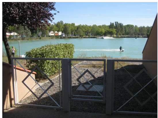
Terrasse Gîtes du Hameau du Lac