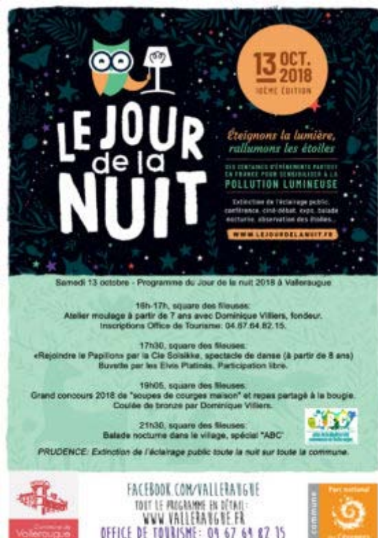
Affiche Jour de la Nuit 2018 valleraugue

Au programme à Valleraugue: extinction de l'éclairage public toute la nuit sur toute la commune ; spectacle de danse, balade nocturne; concours de soupe/repas partagé à la bougie sur le Square des Fileuses; coulée publique de sculpture en bronze; atelier l'après-midi (8 participants sur inscription, voir appel à participants plus bas).